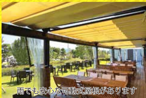
雨でも安心な可動式屋根があります