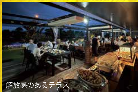
解放感のあるテラス

曜日によってお楽しみ抽選会を実施 ビアガーデンの次回使える割引券などが当たります※裏面をご覧ください