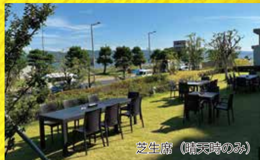
芝生席(晴天時のみ)