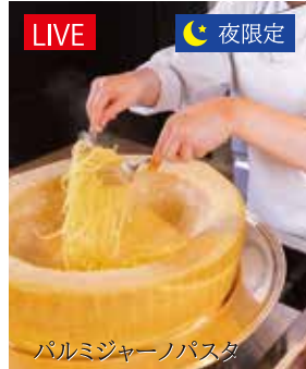
パルミジャーノパスタ