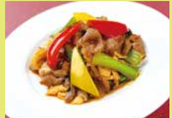
豚肉と玉子の麻辣醬炒め