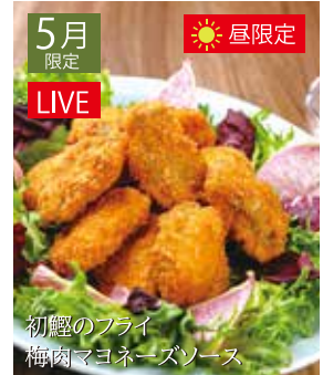
初鱈のフライ 梅肉マヨネーズソース