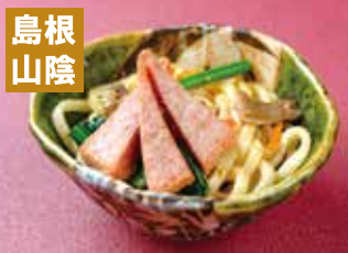
赤天入りXO醬焼うどん