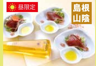
かつおの藻塩タタキ えごまオイルドレッシング