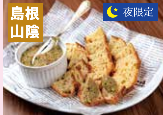
境産鯖と季節野菜のリエット バケット添え