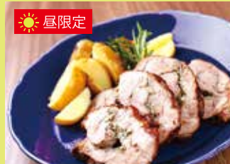
豚肉のオープン焼きハーブの香り ボルケッタ風