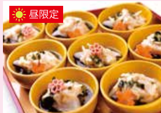
鯖と竹の子真丈重ね蒸し